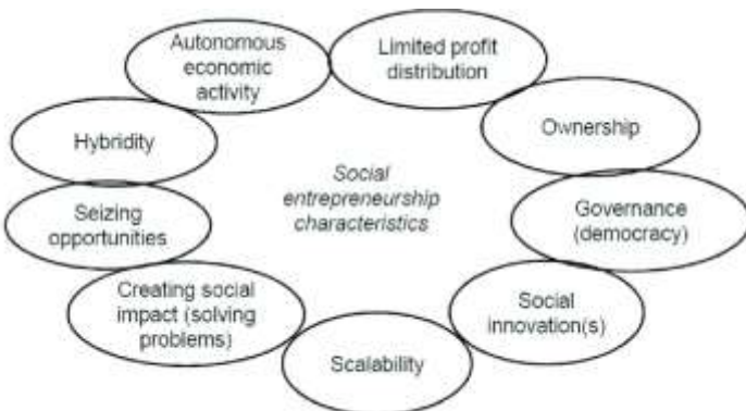
Chart on characteristics of social entrepreneurship.